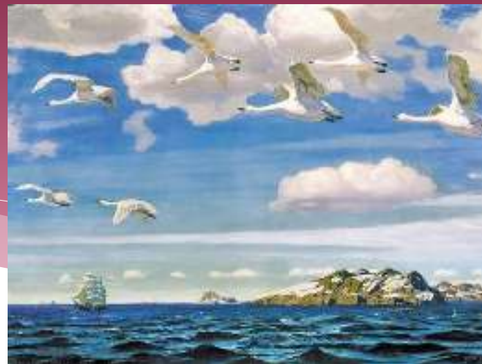
"В голубом просторе" А.А. Рылов,