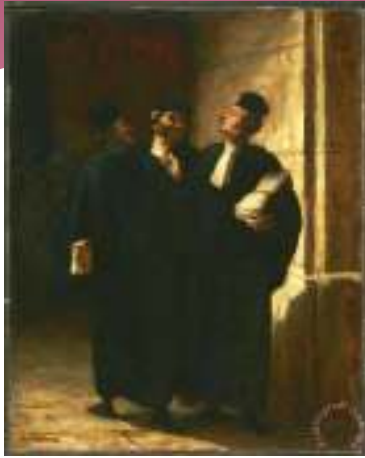
«Три адвоката за разговором»