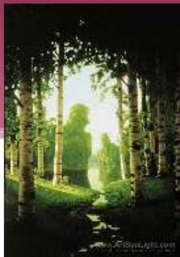
« Березовая роща » А.Куинджи