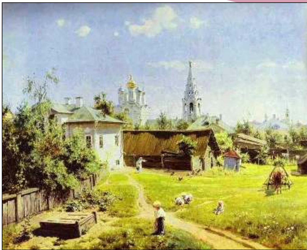
* «Московский дворик» В.Д.Поленова

* Новизну мы обнаруживаем в пейзажах русских художников: «Грачи прилетели» А.К.Саврасова, «Золотая осень» И.И.Левитана.