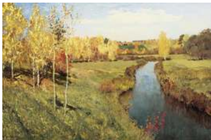
* »«Золотая осень» * И.Левитан