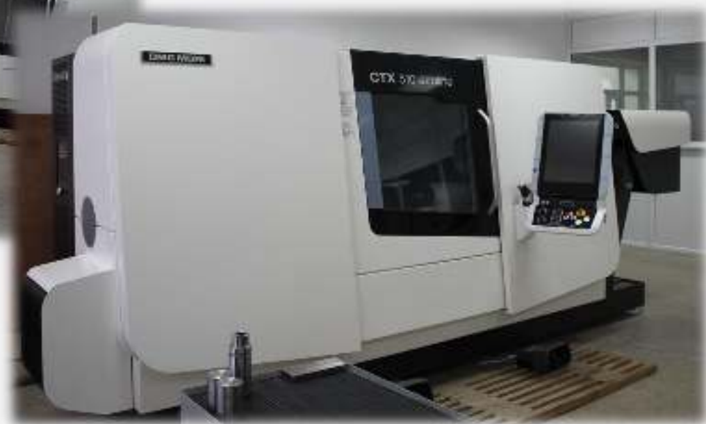
Токарный центр с ЧПУ DMG MORI CTX510

ОБЩАЯ СУММА РЕАЛИЗАЦИИ ПРОЕКТА СОСТАВИЛА 248 872 ТЫС.ТГ