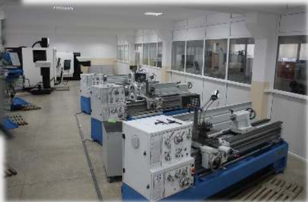
Универсальные токарно-винторезные станки Z 51200