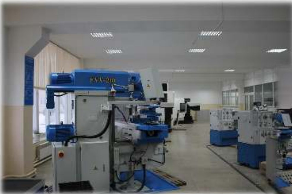
Универсальные фрезерные станки с УЦИ VISPROPM FVV-210