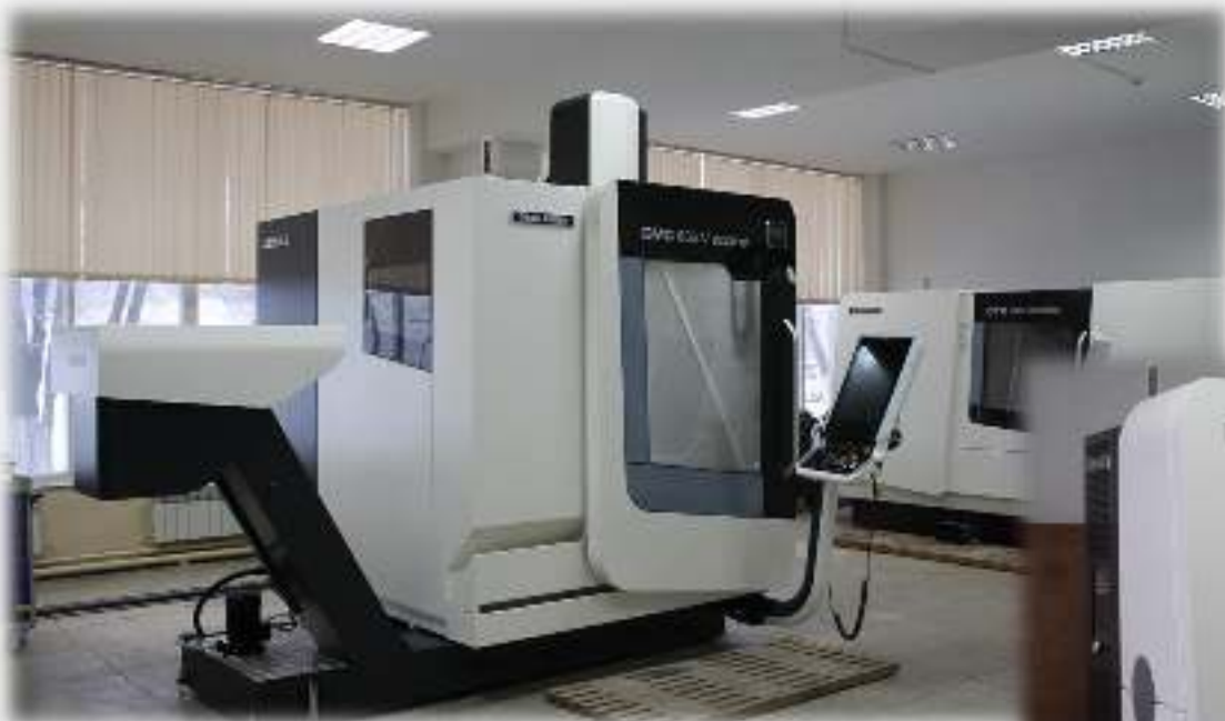
Фрезерный центр с ЧПУ DMG MORI DMC 635V

ОБЩАЯ СУММА РЕАЛИЗАЦИИ ПРОЕКТА СОСТАВИЛА 248 872 ТЫС.ТГ